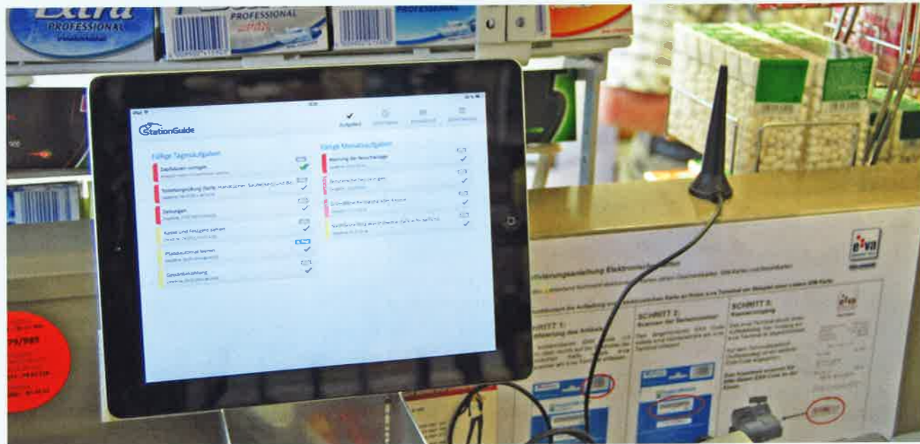
Immer im Blick: die fälligen Tages- und Monatsaufgaben.